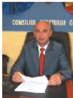
Eugen Chebac Președintele Consiliul Județului Galați, România

“Am considerat întotdeauna Euroregiunea „Dunărea de Jos” o prioritate în activitatea Consiliului Județului pentru că Euroregiunea înseamnă, de fapt, oameni. Și de o parte și de cealaltă a Dunării și a Prutului sunt oameni cu aspirații comune, care împart bucuriile și necazurile traiului la Dunărea de Jos. Iar forțele lor reunite pot aduce în această zonă prosperitatea și buna înțelegere. Euroregiunea este cadrul legal în care inițiativele de dezvoltare trec frontiera, și în care putem să arătăm Europei că proiectele noastre comune sunt viabile și merită tot sprijinul.”